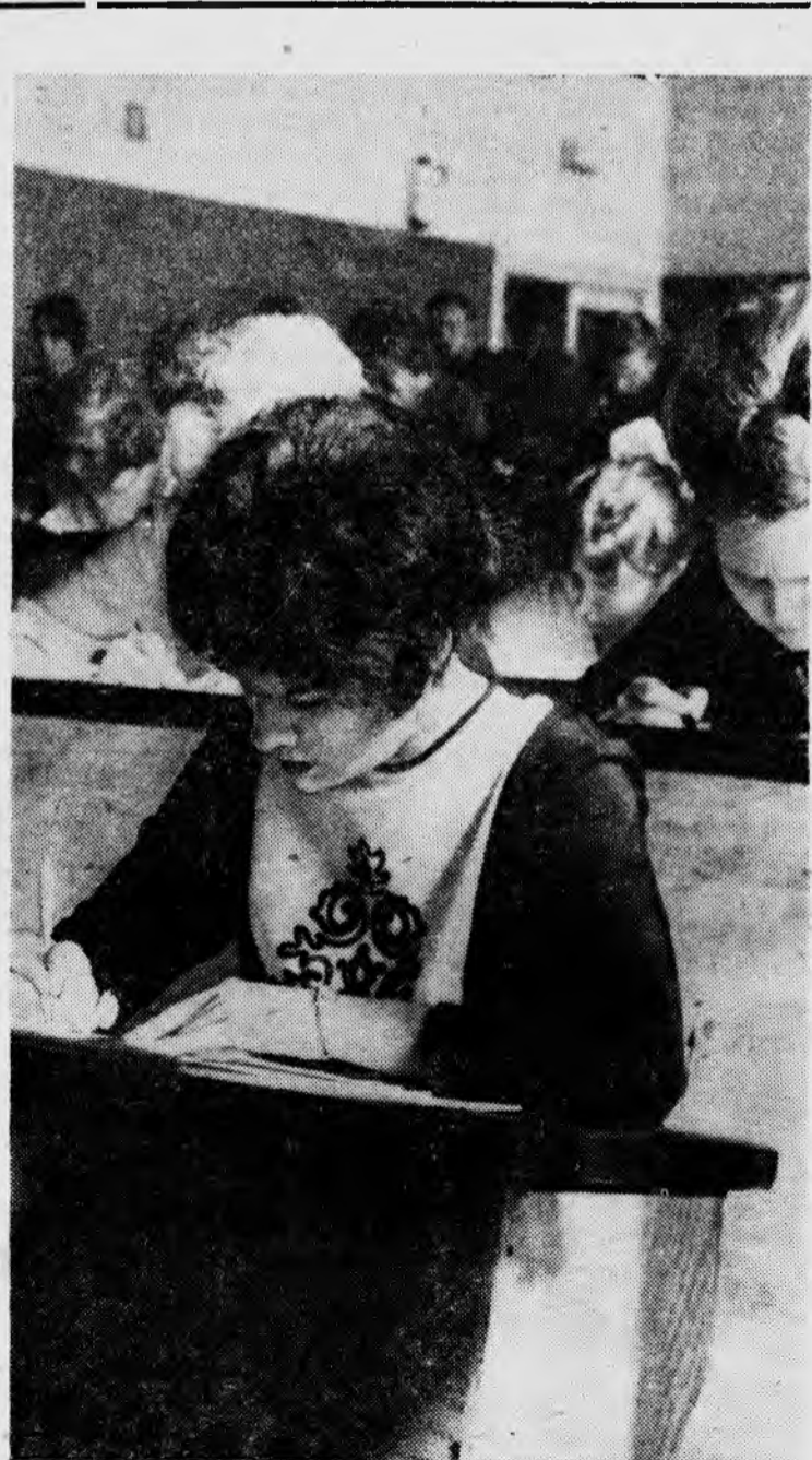
На экзамене.